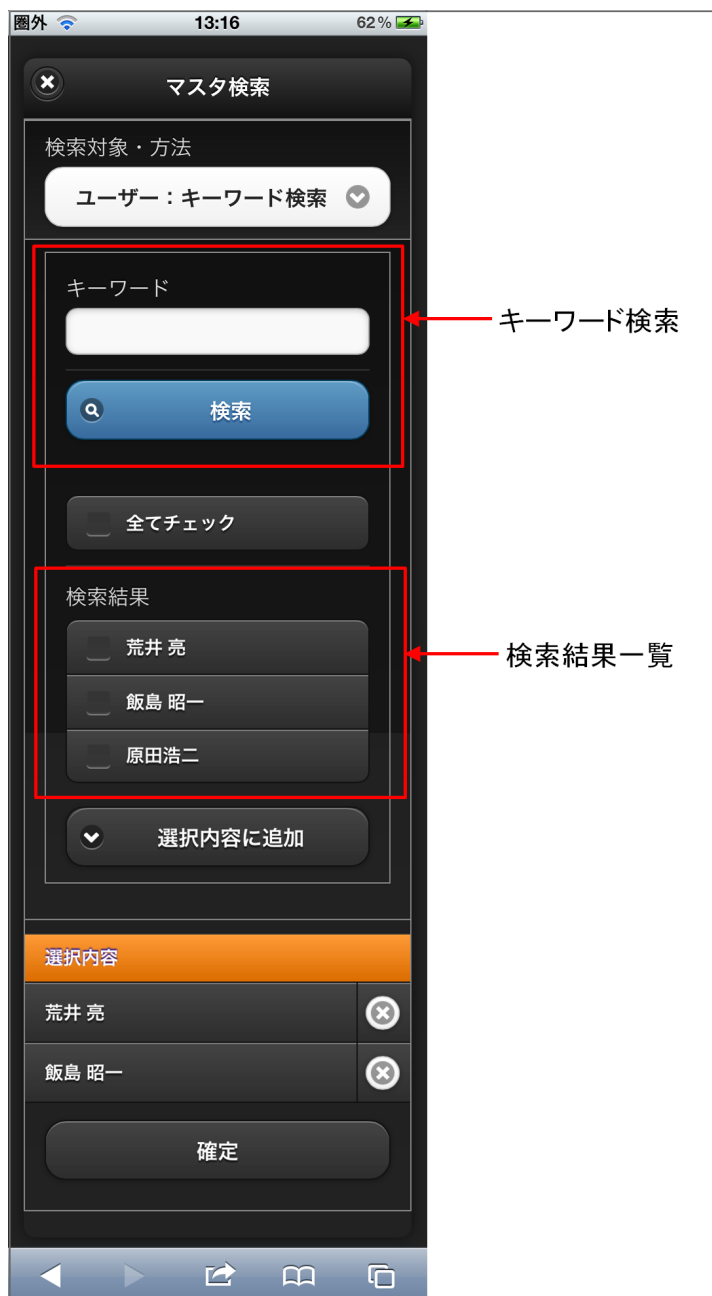
【図：ユーザ検索（キーワード）タブ 画面表示】