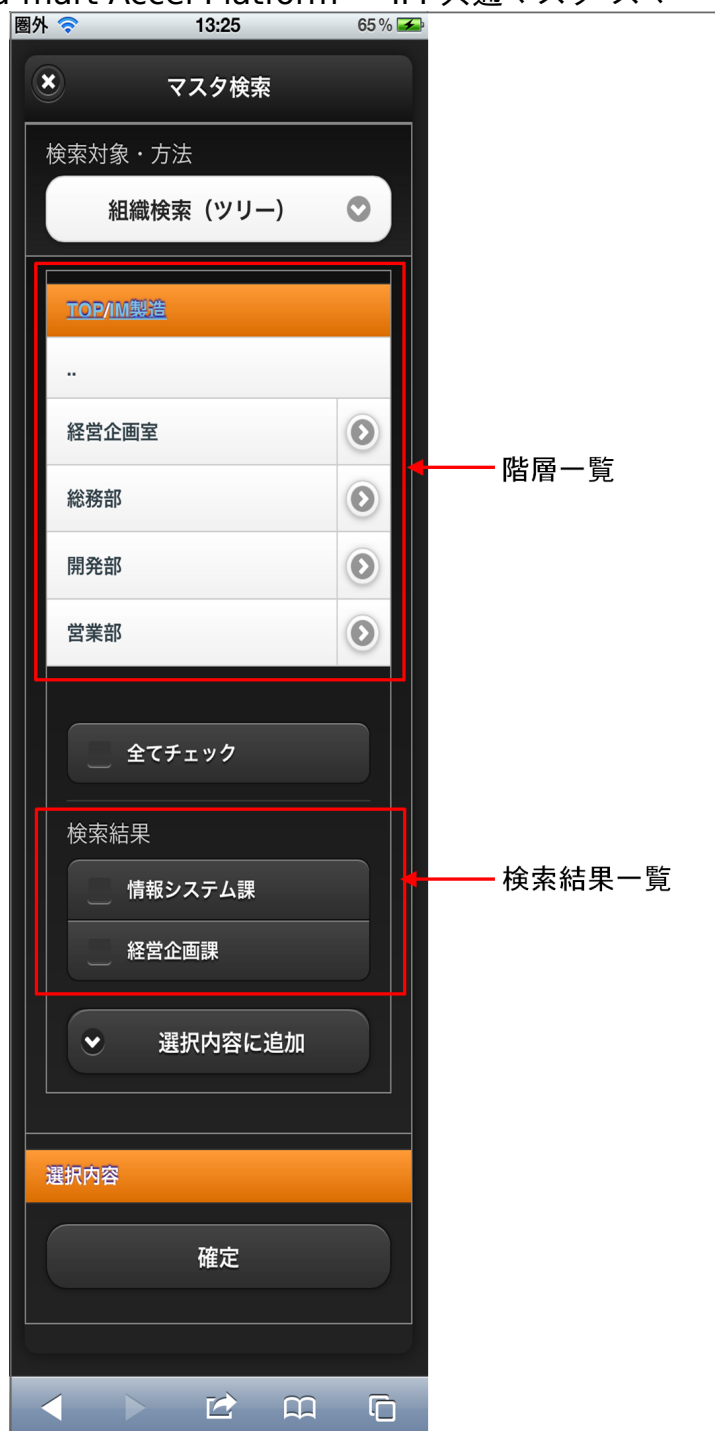
【図：組織検索タブ 画面表示】