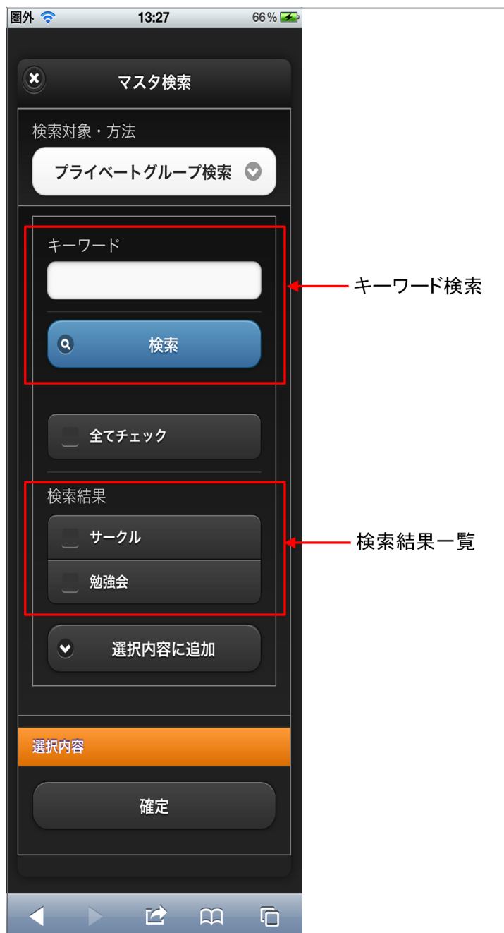
【図：プライベートグループ検索タブ 画面表示】