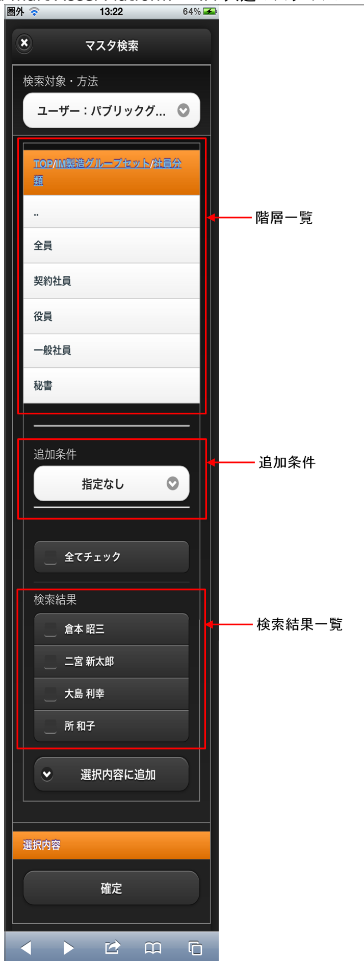
【図：ユーザ検索（パブリックグループ）画面表示】