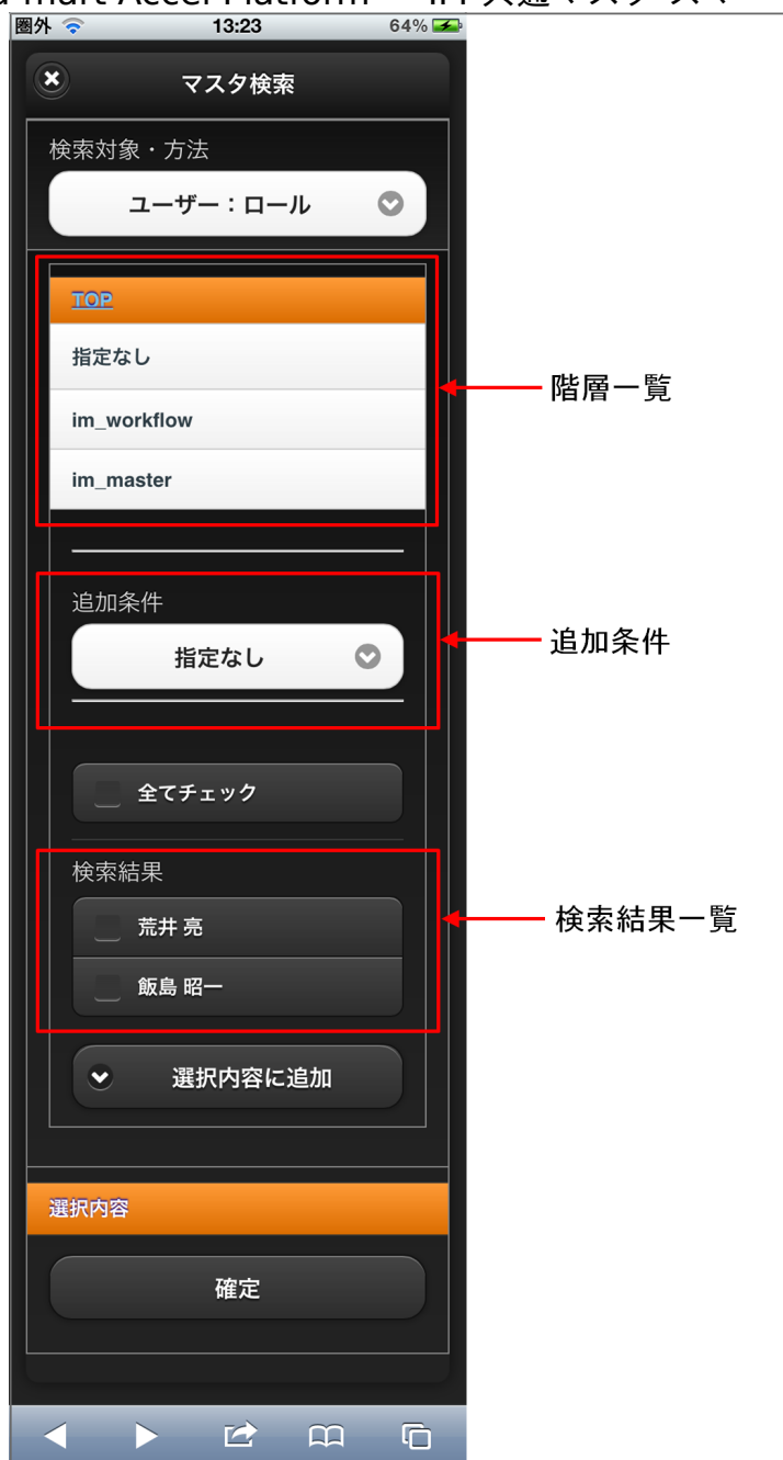
【図：ユーザ検索（ロール）タブ 画面表示】