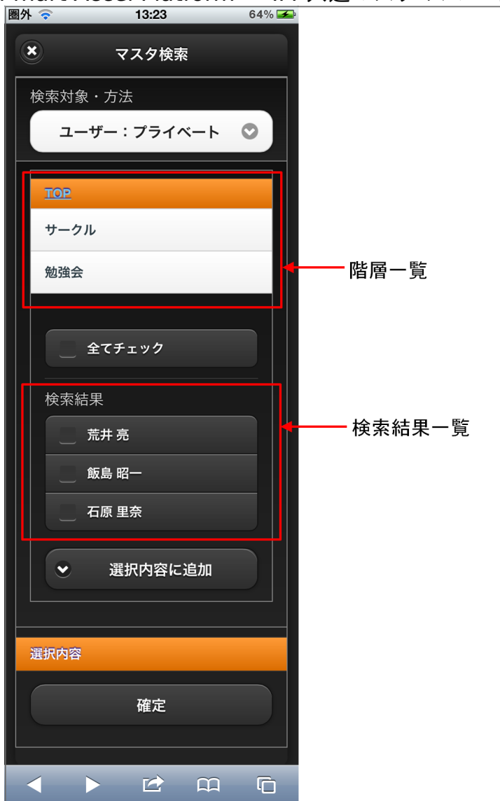
【図：ユーザ検索（プライベートグループ）タブ 画面表示】