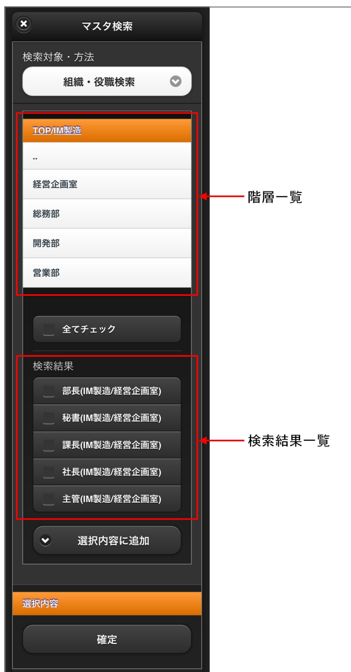
【図：組織・役職検索タブ 画面表示】