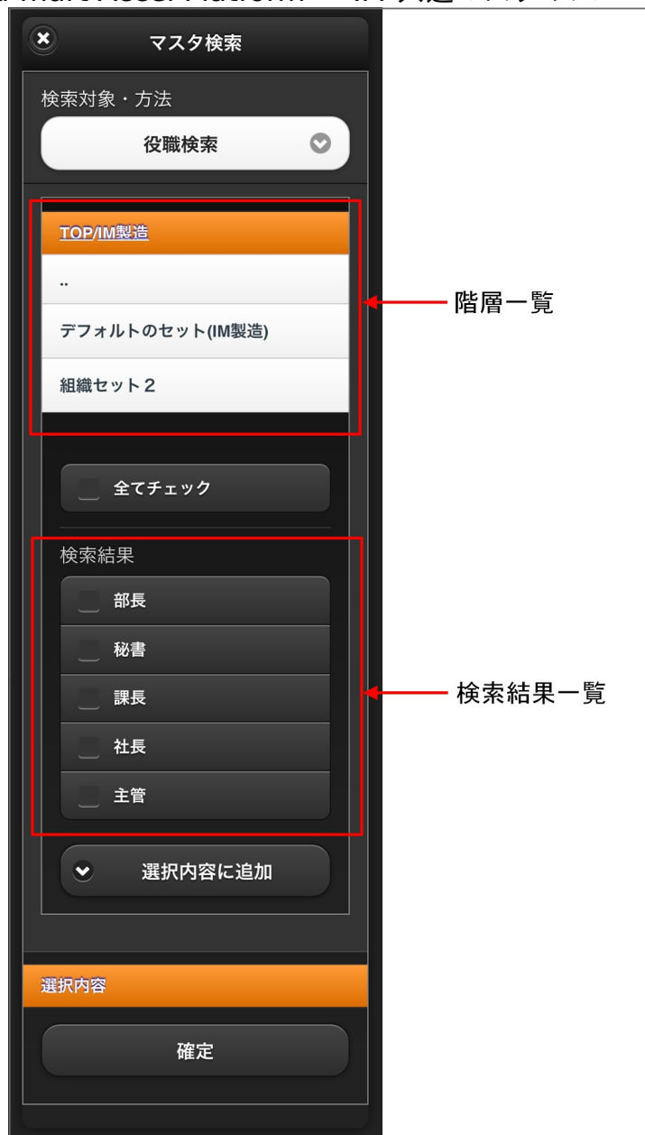
【図:役職検索タブ 画面表示】