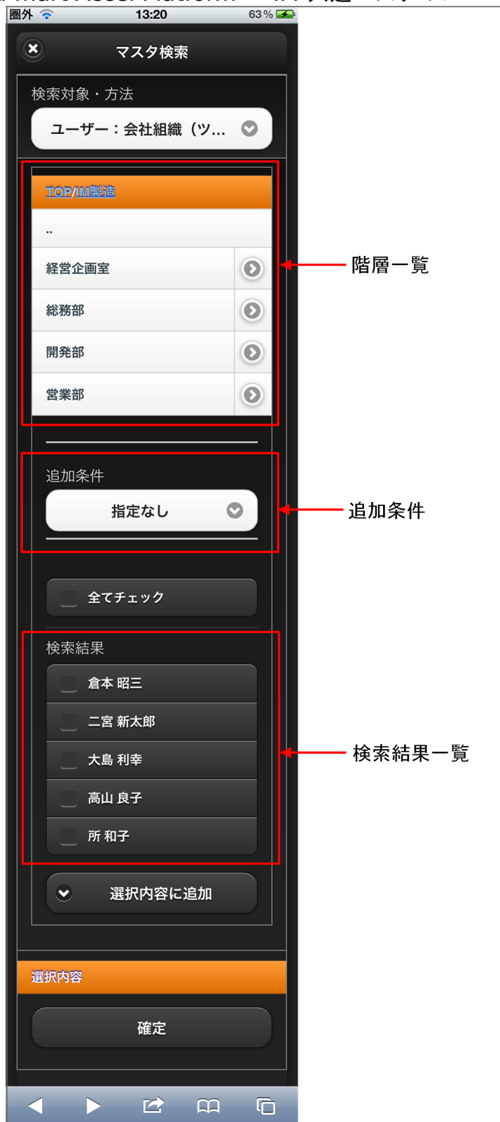
【図：ユーザ検索（組織）タブ 画面表示】