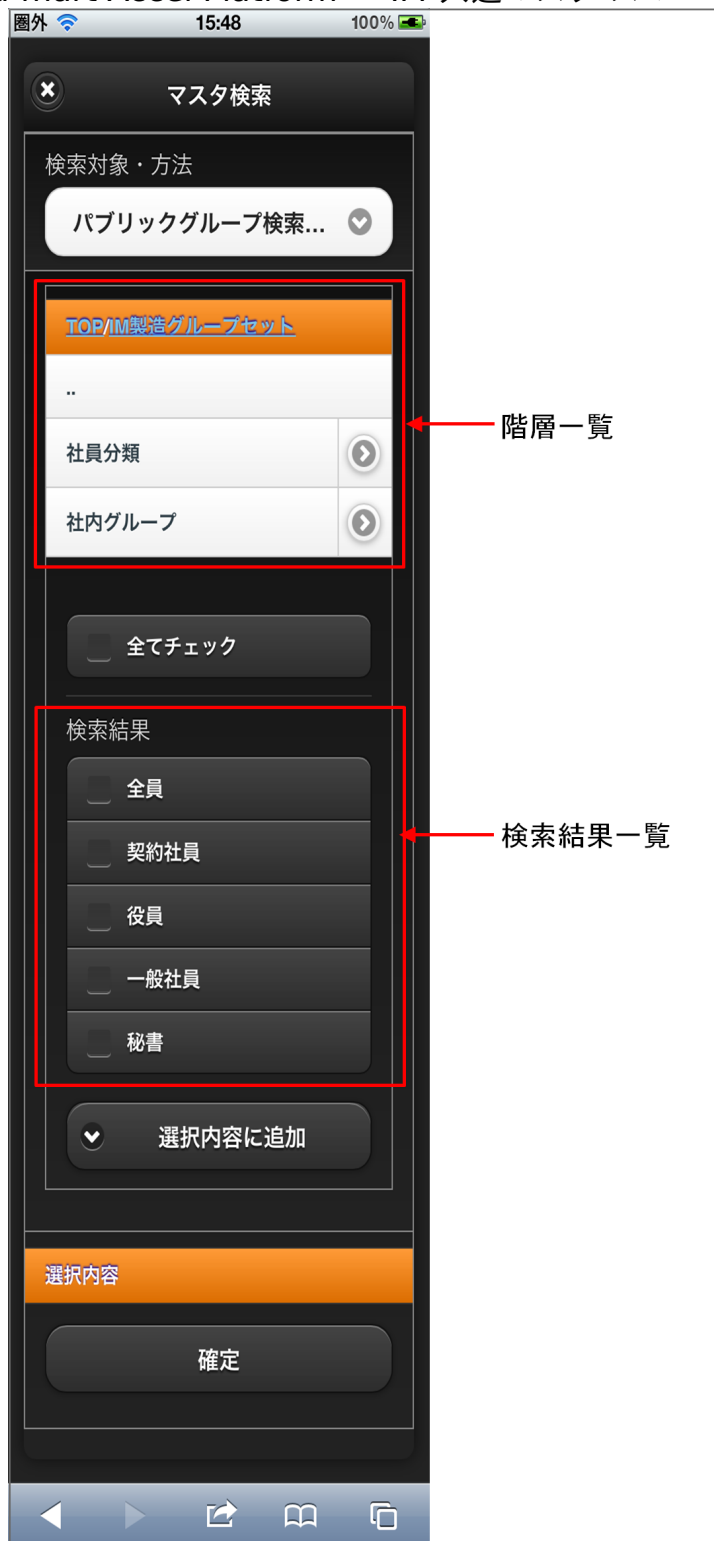
【図：パブリックグループ検索タブ 画面表示】