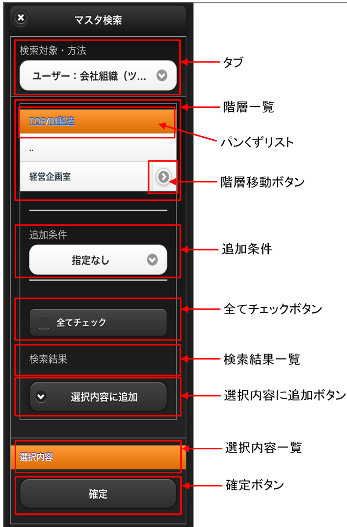
【図：階層+追加条件一覧】