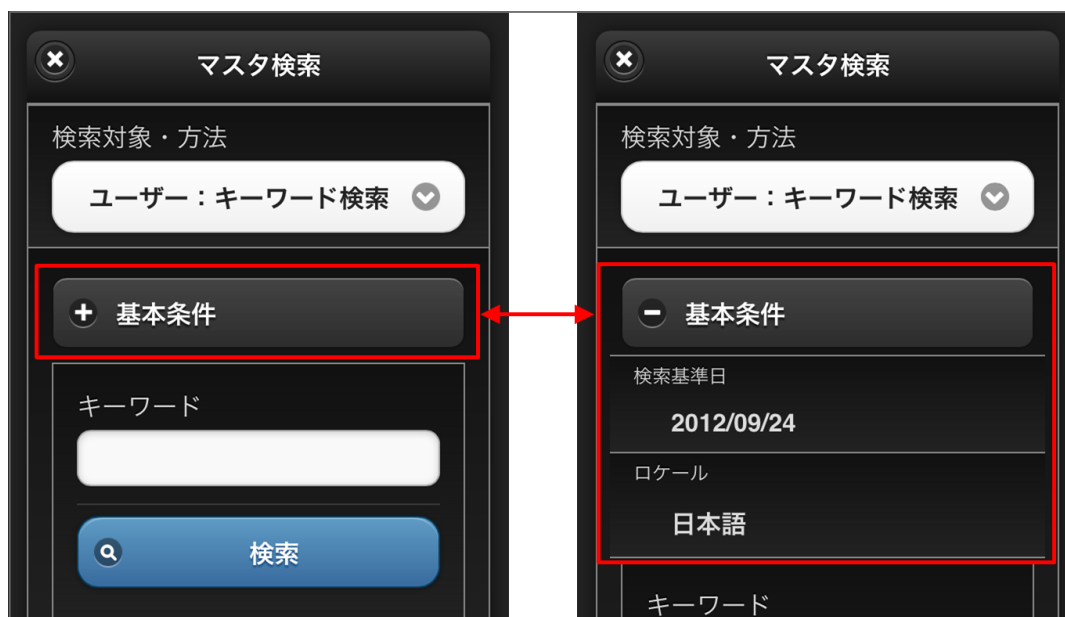
【図：基本情報描画領域】